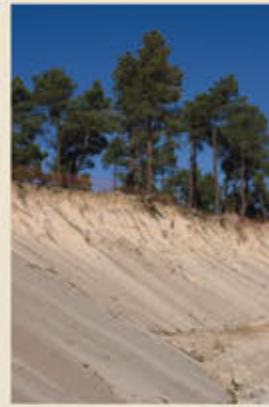
Las dunas más altas de Cantalejo rondan los 15 m de altura.