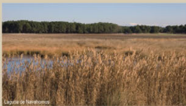
Laguna de Navahornos.

Descripción: corto recorrido que enlaza el aparcamiento de La Muña-Navahornos con el observatorio de la laguna de Navahornos por medio de una pasarela de tarima de madera adaptada para el tránsito de personas discapacitadas o con movilidad reducida.