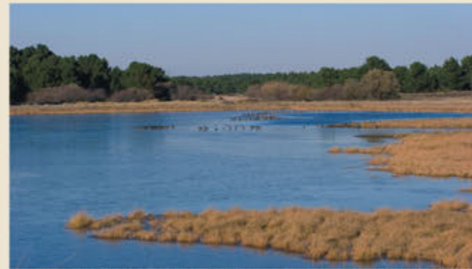
Las lagunas de Cantalejo se inundan en las épocas de lluvia, y se secan durante el estío cuando la evaporación se hace muy intensa.

El espacio natural Lagunas de Cantalejo forma parte de la red europea de espacios protegidos Natura 2000 al haber sido declarado Lugar de Importancia Comunitaria (LIC) y Zona de Especial Protección para las Aves (ZEPa). Se localiza en el centro-este de la provincia de Segovia, en el sector más oriental de la comarca de Tierra de Pinares. Es un enclave de gran valor ecológico y enorme singularidad, dominado por un extenso pinar autóctono que se asienta sobre un llamativo sustrato de arenas blancas modeladas por el viento en forma de dunas. Se extiende sobre una superficie de más de 12.000 ha pertenecientes a los términos municipales de Aguilafuente, Cabezuela, Cantalejo, Fuenterrabollo, Fuentidueña, Hontalbilla, Lastras de Cuéllar, Puebla de Pedraza, Sauquillo de Cabezuela, Turégano y Veganzones.