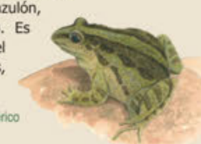
Sapillo pintojo ibérico

En el espacio natural Lagunas de Cantalejo existen poblaciones importantes de especies catalogadas en las directivas de Aves y Hábitats de la Unión Europea. Entre los mamíferos se cuentan el lobo y el murciélago grande de herradura; el sapillo pintojo ibérico destaca entre los anfibios; mientras que la pardilla, la boga y la bermejuela son las especies de peces más significativas. Con todo, es el grupo de las aves el que tiene mayor relevancia. Encabeza la lista la cigüeña negra, que se reproduce en los pinares de Cantalejo y se presenta en el entorno de las lagunas durante la dispersión posreproductora. Los bosques acogen una interesante comunidad de rapaces, con milano real, milano negro, aguililla calzada, azor, culebrera,... De forma ocasional se deja ver el águila imperial ibérica, y se han detectado bandadas prerreproductoras de halcón de Eleonora, que seleccionan el área por su potencial como lugar de alimentación. De forma complementaria, las lagunas atraen a una variada y cambiante representación de aves acuáticas, con especies reproductoras, entre las que destaca el avetorillo, y multitud de anátidas invernantes (azulón, cuchara, cerceta común, tarro blanco). Es además un importante lugar de paso en el que recalán garzas, espátulas, grullas, gansos y limícolas.