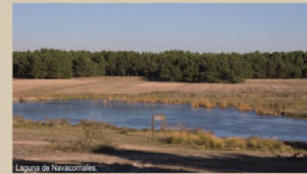
Laguna de Navacornales.

Descripción: senda que atraviesa un sector del pinar que antiguamente se explotaba para la obtención de resina. A lo largo de su trazado se encuentran el observatorio de Sotillos Bajeros, el mirador de la laguna de Navacornales y en el tramo final, común con la Senda de Navalayegua, el observatorio-mirador de la laguna de Navalayegua.