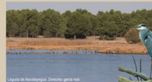
Laguna de Navalayegua. Derecha: garza real.

Descripción: corto recorrido que atraviesa la llanura de inundación y la acequia de Navahornos-Navalayegua para ascender al observatorio-mirador de Navalayegua. En el tramo final, se contacta con la Senda de las lagunas, por la que es posible acceder al observatorio de Sotillos.