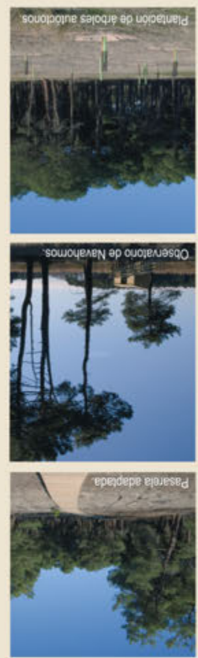
RESTAURACIÓN Y PUESTA EN VALOR DE LAS LAGUNAS

que se ha llevado a cabo mediante un convenio firmado entre la Fundación Biodiversidad y la Fundación del Patrimonio Natural de Castilla y León. Los objetivos principales de este proyecto son: -Sanear la red hidrológica que conecta las lagunas. -Mejorar el hábitat para la fauna y la flora, mediante la sustitución de espiño por vallados de madera, la plantación de árboles y arbustos de especies autóctonas locales, el recrecimiento del vaso de algunas lagunas, etc. -Ordenar el uso público mejorando la red de caminos existente y construyendo aparcamientos, sendas y observatorios ornitológicos, todo ello adaptado al uso por personas con movilidad reducida. -Divulgar los valores del espacio natural para que sea conocido y respetado por el público. Todas estas actuaciones, ejecutadas a lo largo de 2008, serán objeto de seguimiento científico para valorar su impacto en la calidad de las aguas, la fauna y la flora de las lagunas, y sus resultados servirán de base para futuras actuaciones.