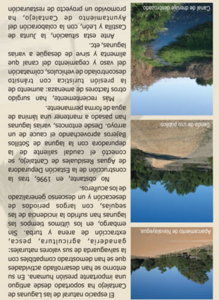
AMENAZAS PARA LA CONSERVACIÓN

que se ha llevado a cabo mediante un convenio firmado entre la Fundación Biodiversidad y la Fundación del Patrimonio Natural de Castilla y León. Los objetivos principales de este proyecto son: -Sanear la red hidrológica que conecta las lagunas. -Mejorar el hábitat para la fauna y la flora, mediante la sustitución de espiño por vallados de madera, la plantación de árboles y arbustos de especies autóctonas locales, el recrecimiento del vaso de algunas lagunas, etc. -Ordenar el uso público mejorando la red de caminos existente y construyendo aparcamientos, sendas y observatorios ornitológicos, todo ello adaptado al uso por personas con movilidad reducida. -Divulgar los valores del espacio natural para que sea conocido y respetado por el público. Todas estas actuaciones, ejecutadas a lo largo de 2008, serán objeto de seguimiento científico para valorar su impacto en la calidad de las aguas, la fauna y la flora de las lagunas, y sus resultados servirán de base para futuras actuaciones.