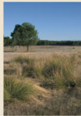
En las depresiones de suelo más húmedo se desarrollan praderas que permanecen verdes hasta bien entrado el verano.

El original sustrato de dunas fósiles que da personalidad al espacio natural de las Lagunas de Cantalejo tiene su origen en los movimientos tectónicos que sacudieron la cuenca del Duero hace un millón y medio de años en la transición del Terciario al Cuaternario. Como resultado, el sector de la actual Tierra de Pinares segoviana se hundió respecto a los terrenos circundantes, activando la acción erosiva de los cursos de agua que recorrían la comarca procedentes de las sierras graníticas del Sistema Central.