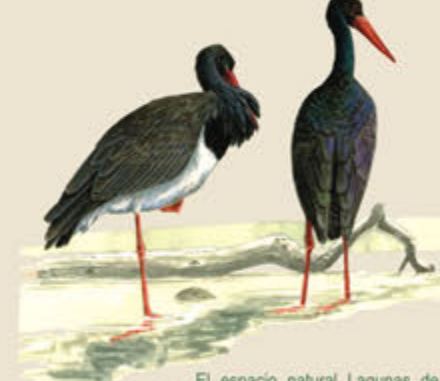
El espacio natural Lagunas de Cantalejo está incluido en el área crítica definida para la conservación de la cigüeña negra.

En el espacio natural Lagunas de Cantalejo existen poblaciones importantes de especies catalogadas en las directivas de Aves y Hábitats de la Unión Europea. Entre los mamíferos se cuentan el lobo y el murciélago grande de herradura; el sapillo pintojo ibérico destaca entre los anfibios; mientras que la pardilla, la boga y la bermejuela son las especies de peces más significativas. Con todo, es el grupo de las aves el que tiene mayor relevancia. Encabeza la lista la cigüeña negra, que se reproduce en los pinares de Cantalejo y se presenta en el entorno de las lagunas durante la dispersión posreproductora. Los bosques acogen una interesante comunidad de rapaces, con milano real, milano negro, aguililla calzada, azor, culebrera,... De forma ocasional se deja ver el águila imperial ibérica, y se han detectado bandadas prerreproductoras de halcón de Eleonora, que seleccionan el área por su potencial como lugar de alimentación. De forma complementaria, las lagunas atraen a una variada y cambiante representación de aves acuáticas, con especies reproductoras, entre las que destaca el avetorillo, y multitud de anátidas invernantes (azulón, cuchara, cerceta común, tarro blanco). Es además un importante lugar de paso en el que recalán garzas, espátulas, grullas, gansos y limícolas.