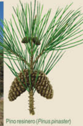
Pino resinero ( Pinus pinaster )

El elemento dominante en el paisaje de Cantalejo es un pinar abierto de pino resinero en el que resulta evidente el aprovechamiento forestal al que ha estado sometido desde muy antiguo, con frecuentes repoblaciones que han contribuido a enmascarar su carácter natural o autóctono. Junto al uso maderero, ha tenido gran importancia la extracción de resina mediante incisiones practicadas en el tronco que ha dejado como huella una profusión de pies retorcidos y tortuosos. Otras especies arbóreas, como los pinos silvestre y piñonero, resultan mucho más escasas, y solo en las riberas del Cega y a orillas de arroyos y canales se presenta una diversidad mayor con álamo blanco, sauce blanco y Fresno de hoja estrecha.