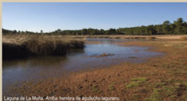
Laguna de La Muña. Arriba: hembra de aguilucho lagunero.

Descripción: breve recorrido que atraviesa el pinar para asomarse a la orilla meridional de la laguna de La Muña, una de las mayores de la zona, en cuyos márgenes se desarrollan densos cañaverales de junco lacustre.